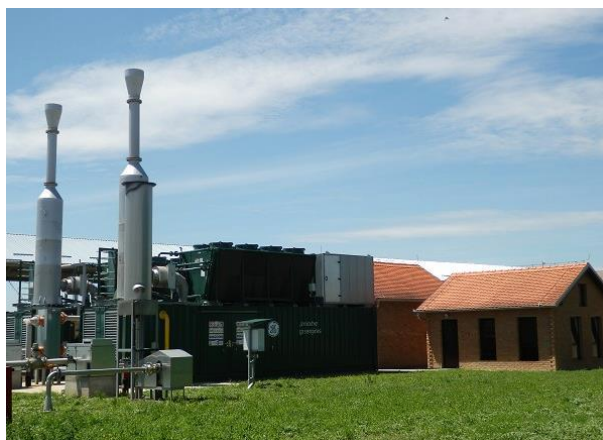
Generatori (plinski motori)