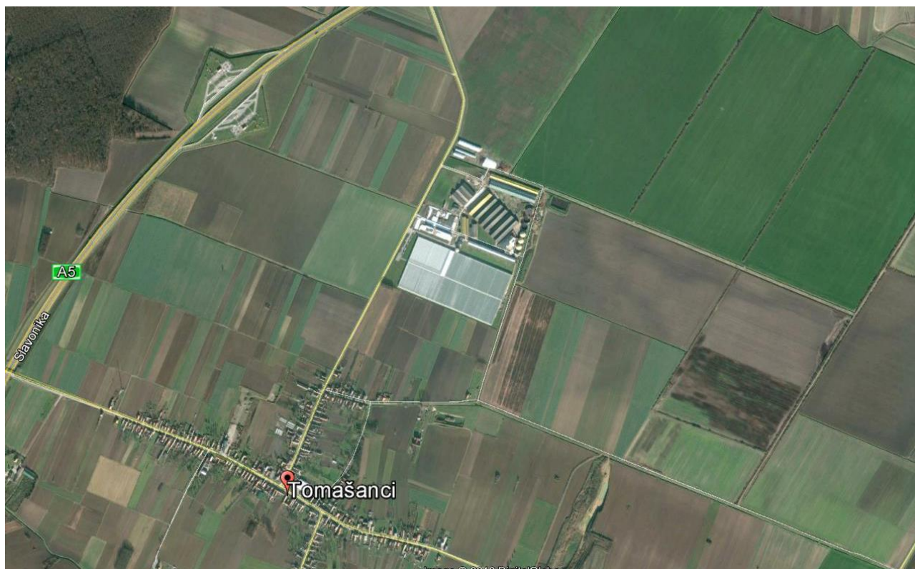
Farma za tov junadi i bioplinsko postrojenje Tomašanci (situacija)